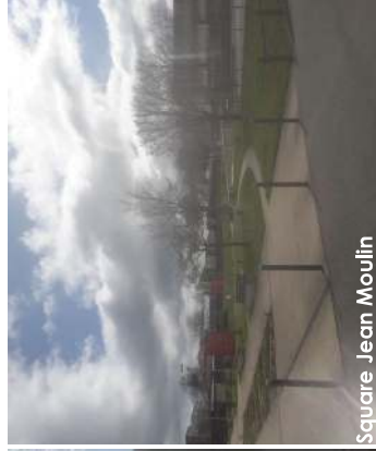
Square Jean Moulin