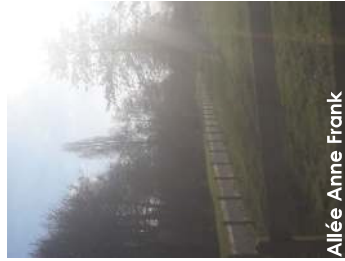
Allée Anne Frank